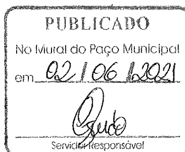
José Luiz de Figueiredo Prefeito Municipal