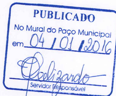
JOSÉ LUIZ DE FIGUEIREDO Prefeito Municipal