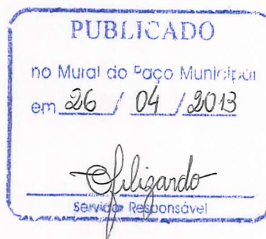
JOSÉ LUIZ DE FIGUEIREDO Prefeito Municipal